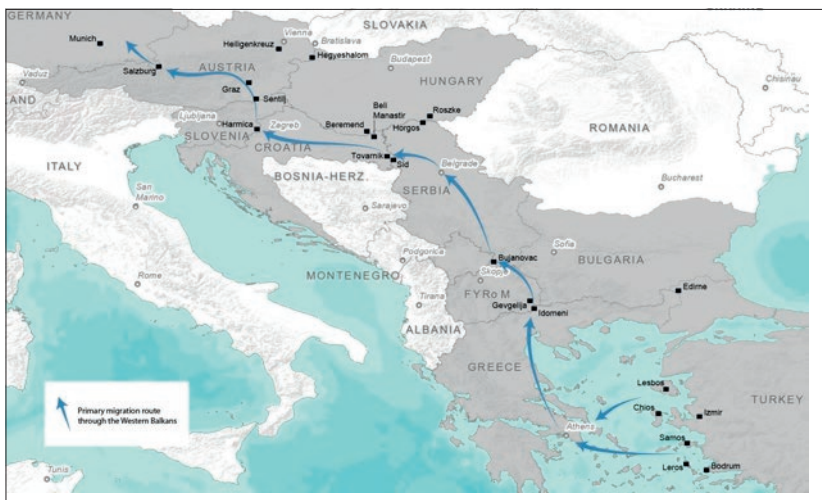
Mapa 1: Primarna migraciona ruta preko zapadnog Balkana, oktobar 2015 — mart 2016.*